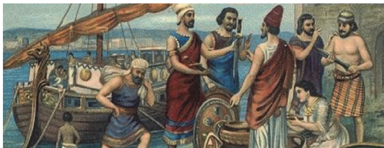
Fenicier i flitig handel

feniciernas nedgång fortsatte grekerna handeln, men det var romarna som satte prägel på platsen genom att etablera staden Suel (ett iberiskt namn) – i provinsen som man då kallade Baetica (efter floden Beatis - dagens Guadalquivir). Huvudort och slutmål för den långa via Augusta från Rom som passerade Suel var Gades – dagens Cadiz. Den romerska orten omnämns som en municipium år 53. Det finns frilagda lämningar efter Suel sydväst om Castillo Sohail och man räknar att orten blomstrade under romarna ända fram till ca år 400 som handels- och sjöfartsplats för inte bara malmerna utan även säd, konserverad fisk (garum), vin, olivolja och marmor från brotten i Mijas.