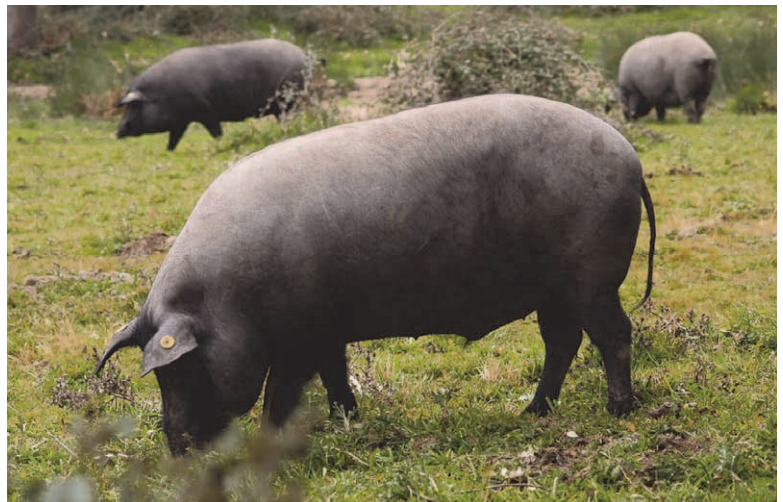
Liksom andra grisar tillbringar ibericogrisen dagen med att böka och äta

Grisen som särskiljer sig med mörk hud och svarta klövar ( pata negra betyder svart fot/hov/ben) har sina huvudsakliga anlag från Afrika och den nämns redan på 1600-talet. Den har anpassat sig väl till det heta klimatet på sydvästra iberiska halvön (Europas varmaste!). Ibericogrisens framgång på den mänskliga taffeln beror kort sagt på den stora mängd fett som är insprängt i köttet. Efter att grisen har bökat frigående under uppväxten får den de sista tre månaderna före slakt äta enbart ekollon och örter. Detta förhöjer smaken på köttet och man kan jämföra med produktionen av USA-beef och kobe-kött från Japan.