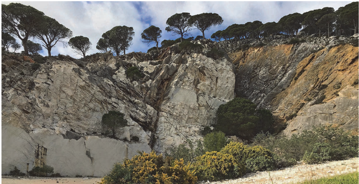
Marmorbrotten i Mijas har använts i tusentals år

Det dröjde till 930-talet då kalifen i Cordoba, Abd al-Rahman III, besegrade Hafsuns koalition och fortsatte kontrollen över hela kalifatet som då omfattade 70% av Iberiska halvön, Balearerna och Marocko. Rahman lät rekonstruera fästningen i Fuengirola och etablera en bosättning.