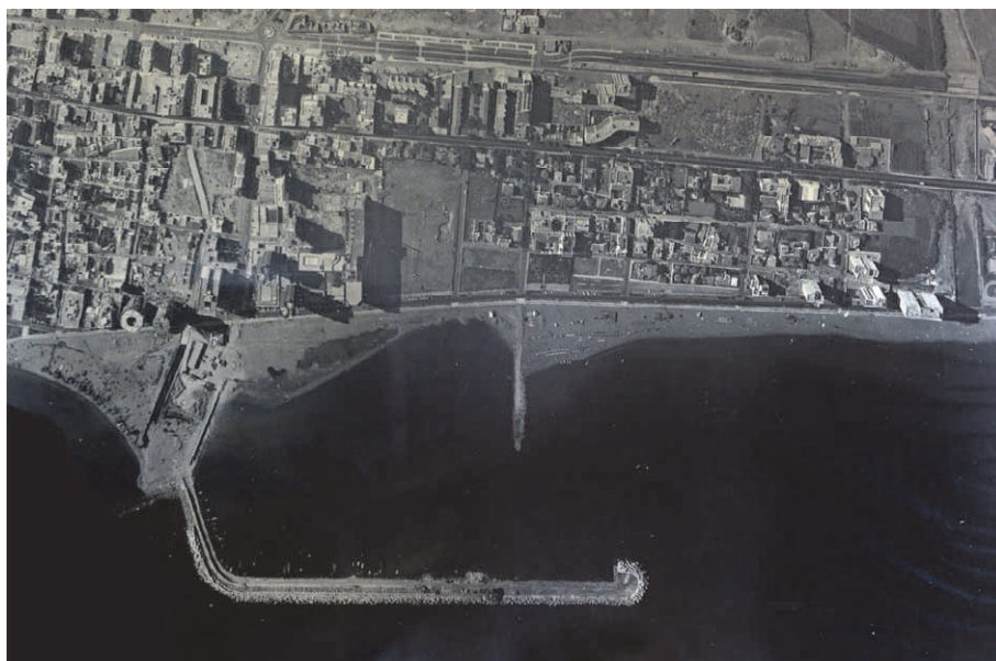
I början av 1970-talet

Först 1973 kunde pga ekonomiska svårigheter arbetet med yachthamnen (Puerto Deportivo) påbörjas på den del som reserverats för detta. Byggandet av pontoner, kommersiella lokaler båtvarv, parkeringsplatser utfördes av bolaget Auxini. Club Nautico etablerades 1978 och 1982 kunde Marinan invigas officiellt. Fisket har gått tillbaka som i alla andra europeiska fiskelägen, men försörjer fortfarande en del av de lokala fiskrestaurangerna.