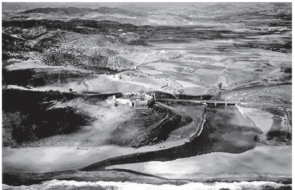
Borgen och Rio Fuengirola i början av 1900-talet. På feniciernas tid var floden en djup havsvik.

Det är en ödets slump att detta år förenar Sverige och Fuengirola. Napoleonkrigen pågår för fullt och Sverige tvingas just detta år att förklara krig mot sin handelspartner England. Vår nye tronföljare Jean Baptiste Bernadotte anländer till Helsingborg och den gamla fästningen i Fuengirola får tillfälle att utkämpa ett bittert slag i konflikterna med Napoleon.