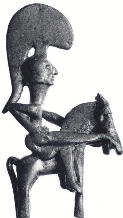
Iberisk bronsskulptur från ca 600 f Kr

Mänskliga spår – kanske 20.000 år gamla – i form av väggmålningar finns att beskåda i Pileta-grottan vid Ronda. Under istiden var klimatet förstas mycket annorlunda jämfört med idag. Man hade kommit vandrande från öster i vågor och levde som jägare och samlare. Redskapen var av sten som överallt annars.